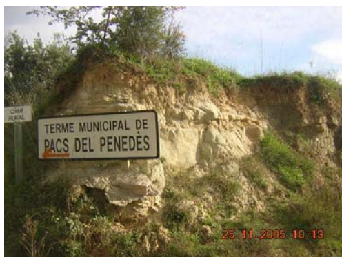
Tram 4: Límit de terme