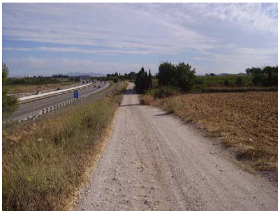
Tram 2: Estat del ferm