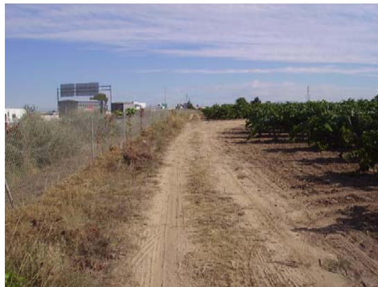
Tram 4: Estat del ferm.