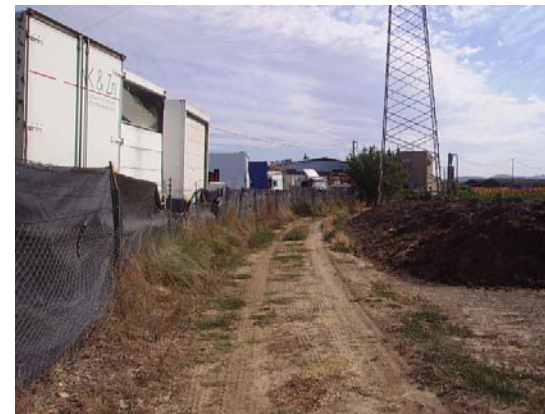
Tram 4: Estat del ferm.