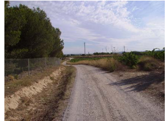
Tram 2: Estat del ferm.