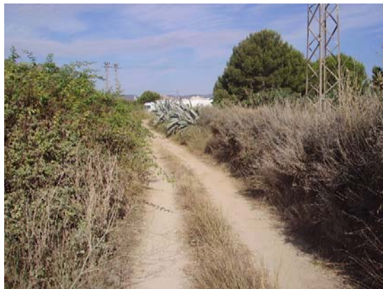
Tram 4: Estat del ferm