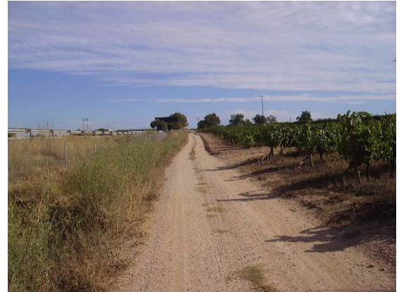
Tram 3: Estat del ferm