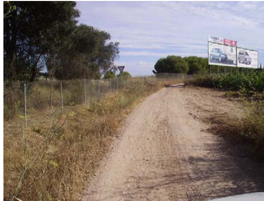
Tram 1: Estat del ferm.