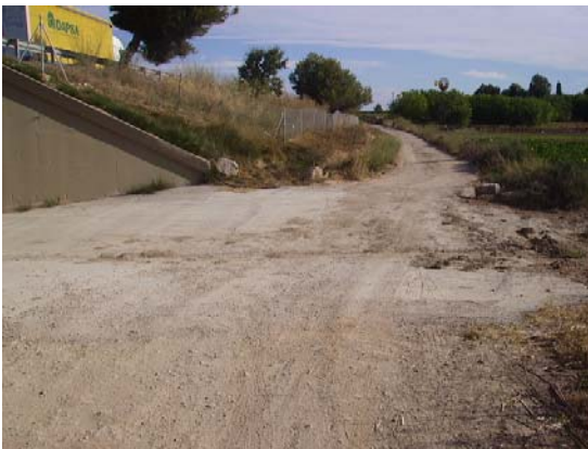
Tram 3: Intersecció amb la riera de Santa Maria