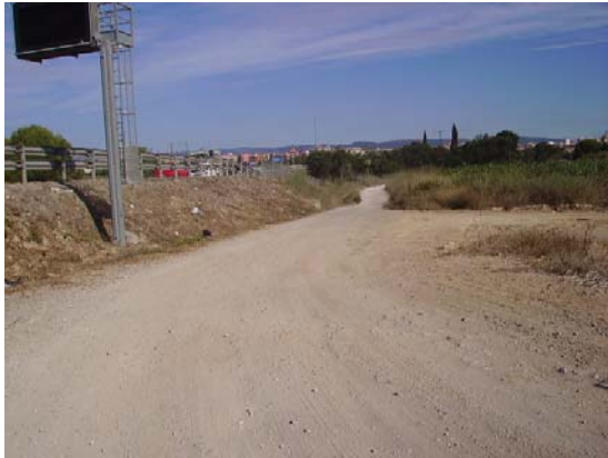
Tram 1: Estat del ferm. Enllaç amb C15