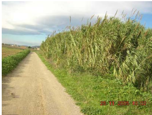
Tram 2: Estat ferm