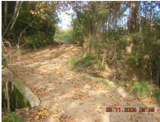
Tram 2: Pas riera de Llitrà