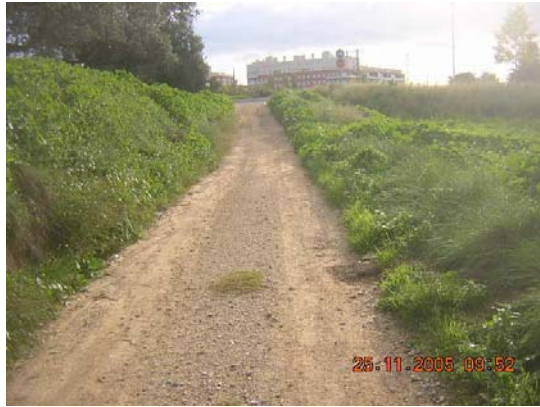
Tram 1: Tipus ferm