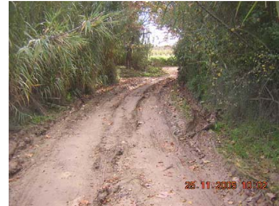
Tram 2: Zona propera al pas de la riera de Llitrà