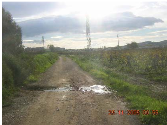
Tram 1: Estat ferm