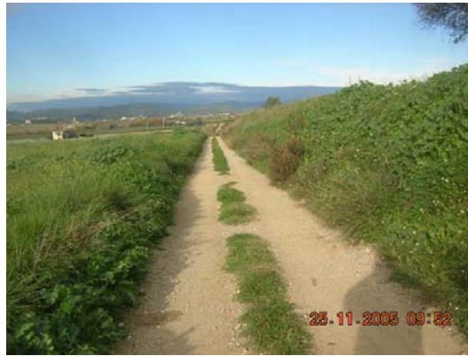
Tram 1: Estat ferm