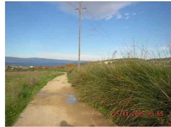
Tram 1: Tipus ferm