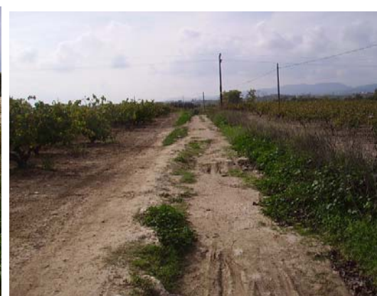
Tram 1: Estat del ferm i marges