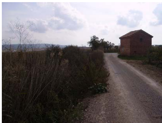
Tram 1: Enllaç Ctra. de la Múnia