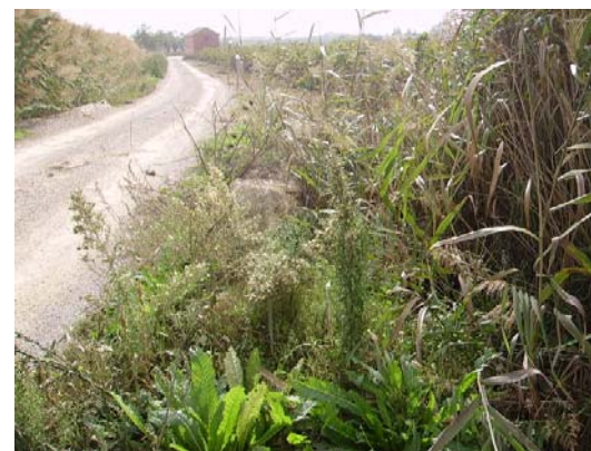
Tram 1: Detall cuneta