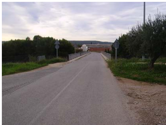
Tram 4: Pont sobre l'AP7