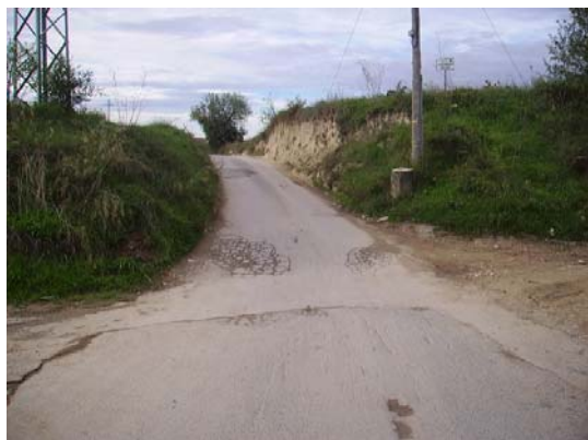
Tram 1: Limit de terme