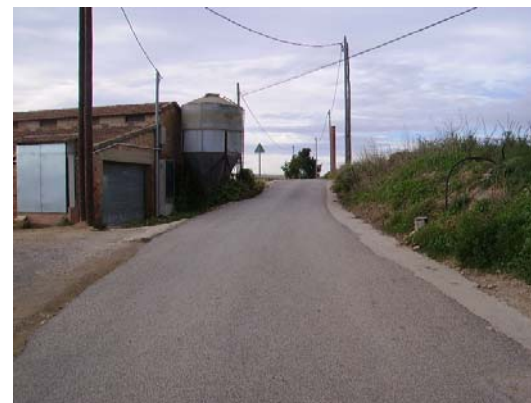
Tram 2: Granges del Pere Ferran de Casals