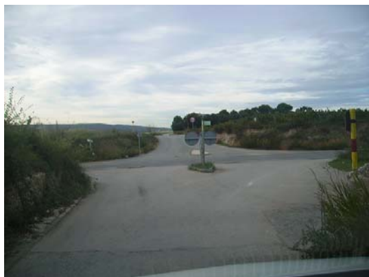
Tram 3: Enllaç ctra. de la Múnia