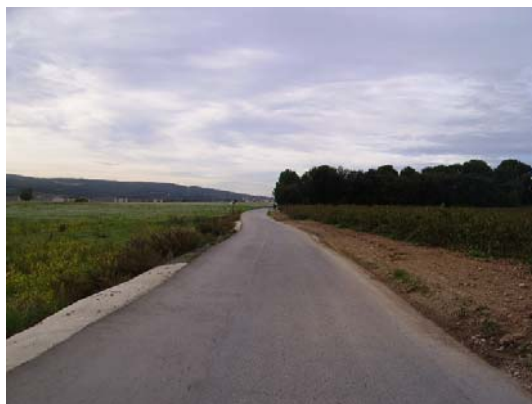
Tram 4: Tipus de ferm