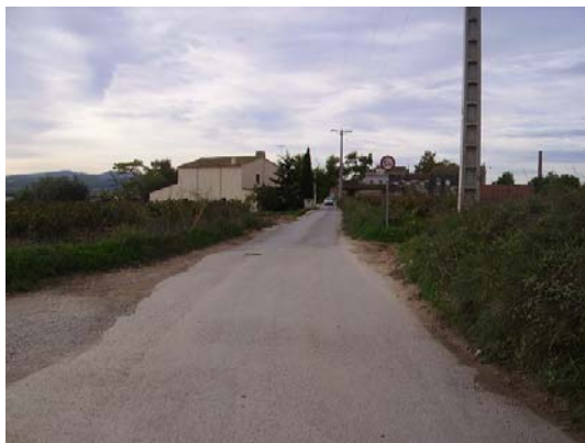
Tram 2: Cal Ton Ferriol