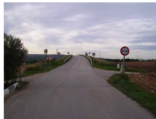
Tram 4: Pont sobre la N340 (t.m. Monjos)