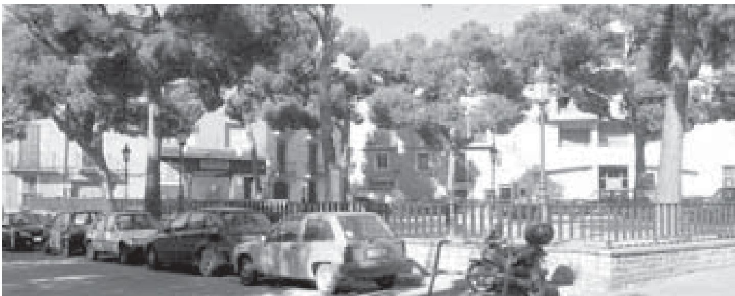
La remodelació de la plaça de Milà i Fontanals dóna un tractament tou a l'espai central on s'hi conserven els pins existents i la posició sobreelevada es resol amb rampes i esglaonats per vèncer les barreres arquitectòniques.

D'altra banda, el projecte d'urbanització de l'aparcament de les Clotes consistirà en la configuració d'un aparcament d'uns 7.300 m 2 sota arbres per a turismes amb unes 114 places. Amb aquest projecte l'Ajuntament pretén consolidar aquest solar com aparcament dissuasori per als vehicles que accedeixen a la Vila, com a suport als esdeveniments que es realitzen al recinte firal de la Zona Esportiva i com aparcament pròpiament de l'Institut Milà i Fontanals. El projecte preveu que l'aparcament estigui asfaltat i tingui entrades i sortides pel carrer Ferran i pel carrer Balcó de les Clotes. També s'hi inclou la construcció de voreres perimetrals envoltant l'aparcament i la plantació gairebé 200 arbres i uns 550 arbustos.