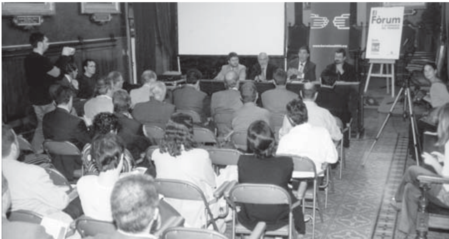
Imatge de la presentació dels actes que Vilafranca celebrarà amb motiu del Fòrum Barcelona 2004.

Amb aquests acord, Vilafranca del Penedès es converteix en municipi col·laborador del Fòrum, figura que s'atorga en virtut d'un conveni singularitzat amb cadascun dels ajuntaments interessats. Els ajuntaments poden organitzar actes que tinguin relació amb els tres eixos programàtics de l'esdeveniment del 2004: diversitat cultural, desenvolupament sostenible i condicions de la pau. Aquestes activitats, amb l'autorització prèvia del Fòrum, es poden anunciar com a actes associats a la programació del Fòrum Barcelona 2004.