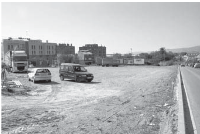
El nou aparcament que es farà al final del Balcó de les Clotes preveu una capacitat per a 114 vehicles.

L'Ajuntament de Vilafranca ha sol·licitat la inclusió de Vilafranca en el Pla Únic d'Obres i Serveis de Catalunya (PUOSC) per al període 2004-2007 que convoca la Generalitat de Catalunya per tal que siguin subvencionats dos projectes municipals destacats en aquesta legislatura. Així, l'Ajuntament sol·licita la inclusió al PUOSC per a l'any 2004 i amb l'ordre de prioritat 1 del projecte de remodelació de la plaça de Milà i Fontanals. L'Ajuntament sol·licita a la Generalitat una subvenció del 50% per aquest projecte que està valorat amb un pressupost de gairebé 527.000 euros (més de 87 milions de pessetes). Per a l'any 2005 i amb l'ordre de prioritat 2, l'Ajuntament també ha sol·licitat al PUOSC la urbanització com aparcament de l'espai delimitat pel vial de les Clotes, el carrer Ferran i el balcó de les Clotes i que està tocant a la carretera de Sant Martí Sarroca. Per aquest projecte, que està valorat en gairebé 472.000 euros (més