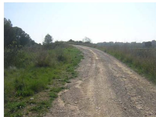
Tram 1: Pas sobre la línia de rodalies RENFE