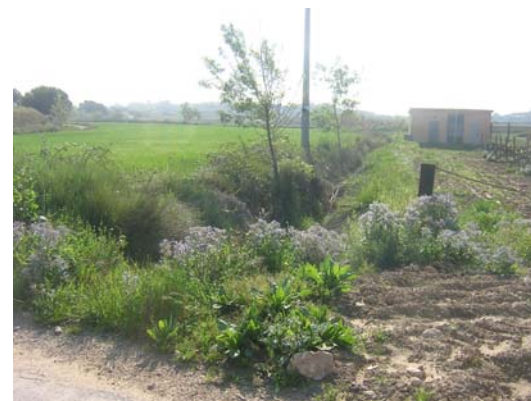
Tram 1: Rasa