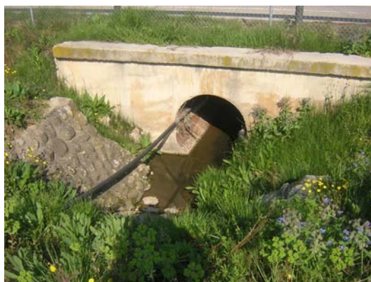
Tram 1: Pas d'aigua N340