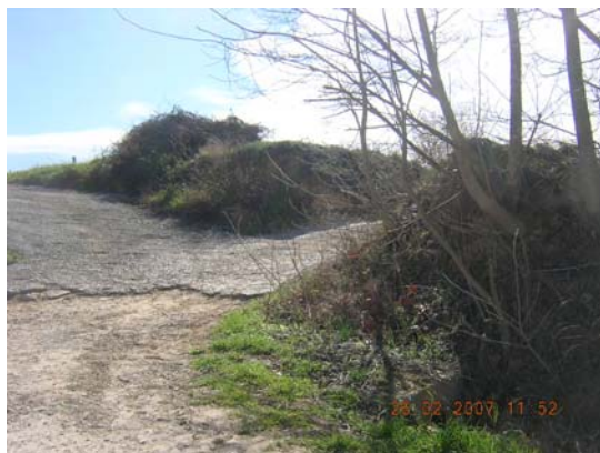
Tram 1: Enllaç amb el camí de Meliό.