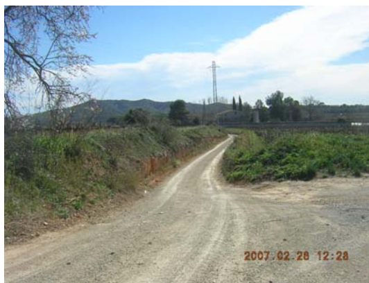
Tram 2: Enllaç amb el camí lateral de l'AP7.