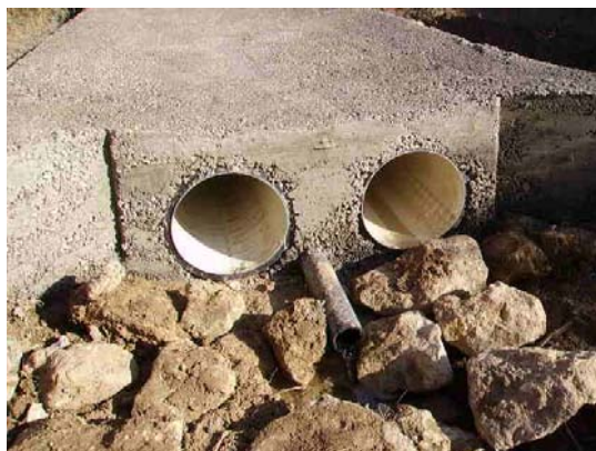
Tram 3: Gual existent.