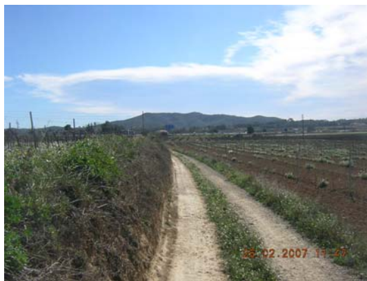
Tram 1: Estat del ferm.