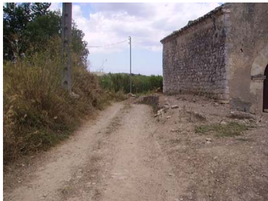
Tram 2: Ermita.