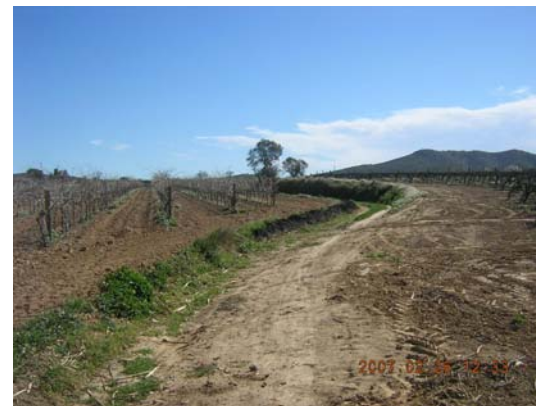
Tram 3: Estat del ferm