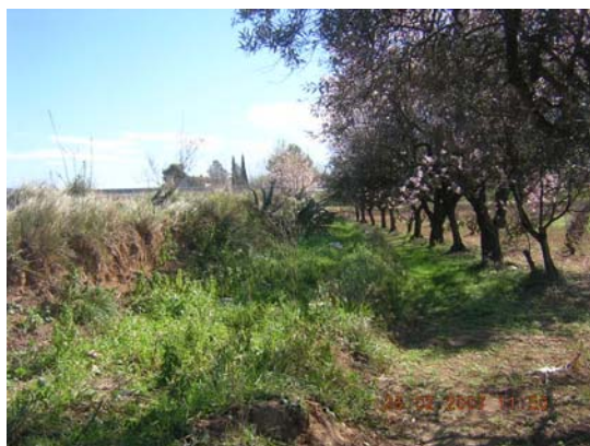
Tram 1: Estat del ferm i marges.