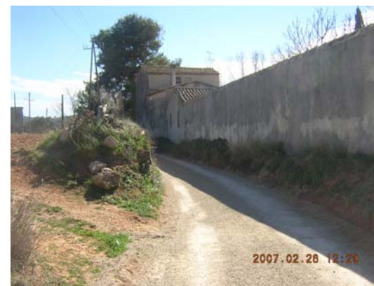
Tram 2: Masia de Santa Maria dels Horts