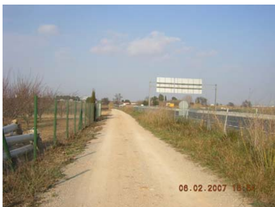
Tram 2: Estat del ferm i tanca AP7