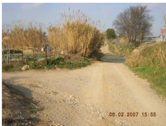
Tram 2: Enllaç camí Mas Rabassa. Gual riera.