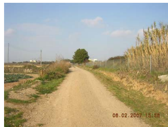
Tram 3: Estat del ferm