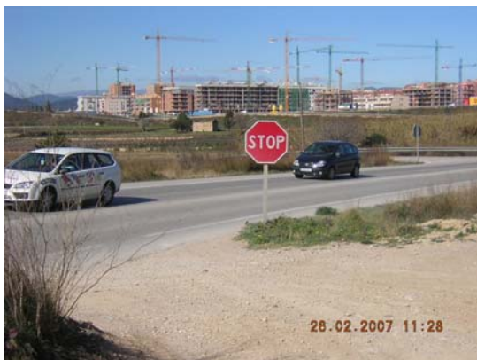
Tram 1: Enllaç C14 i senyalització