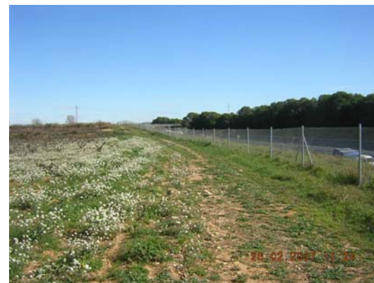
Tram 1: Fi del primer tram. Estat del ferm.