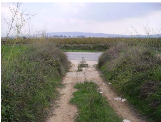
Tram 4: Enllaç ctra. Sant Sadurní