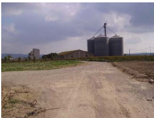
Tram 3: Accés a la subestació FECSA ENDESA