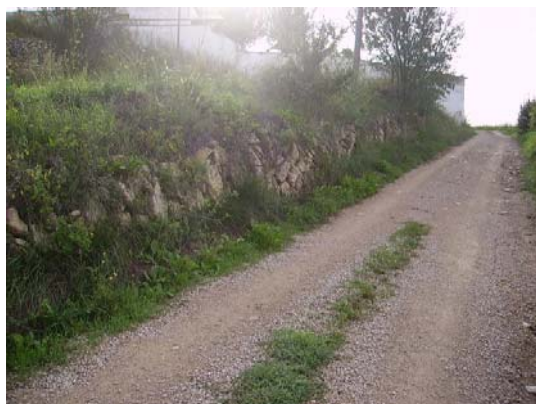
Tram 2: Marge de pedra