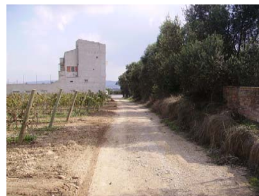
Tram 3: Enllaç ctra. Igualada (actual C14)