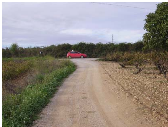
Tram 1: Enllaç ctra. de les Cabanyes