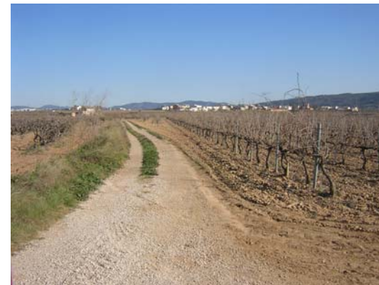
Tram 2: Estat del ferm