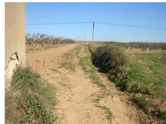
Tram 3: Estat del ferm