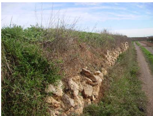
Tram 2: Marge de pedra seca