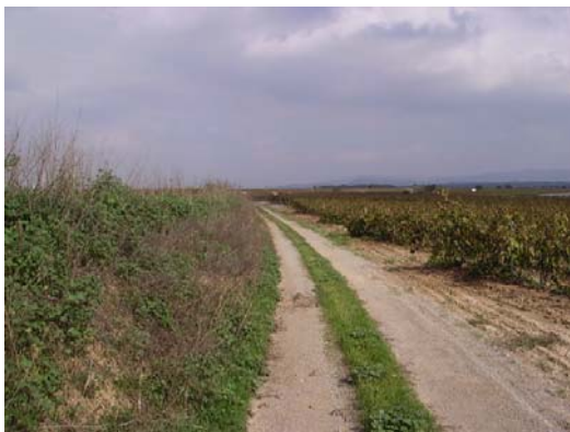
Tram 1: Tipus ferm