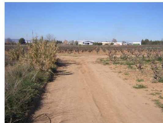
Tram 1: Enllaç camí de Sant Pere Molanta.