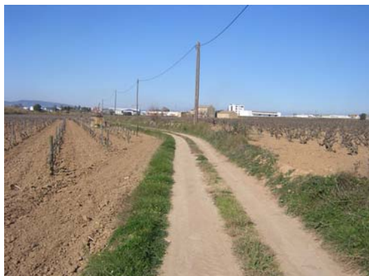
Tram 1: Estat del ferm.