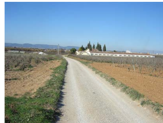
Tram 1: Granja Morros