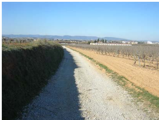
Tram 1: Estat del ferm.