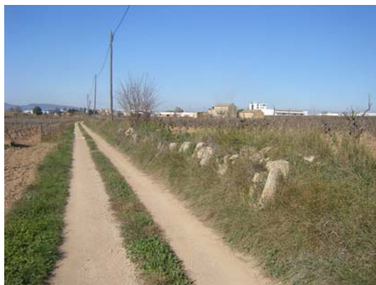
Tram 1: Detall mur de pedra seca.