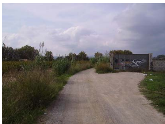
Tram 1: Parcel·la vallada