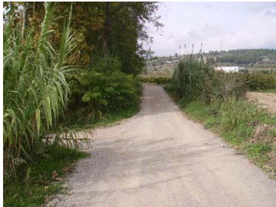
Tram 1: Enllaç camí riera de Llitrà