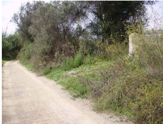
Tram 1: Pedra de límit de terme