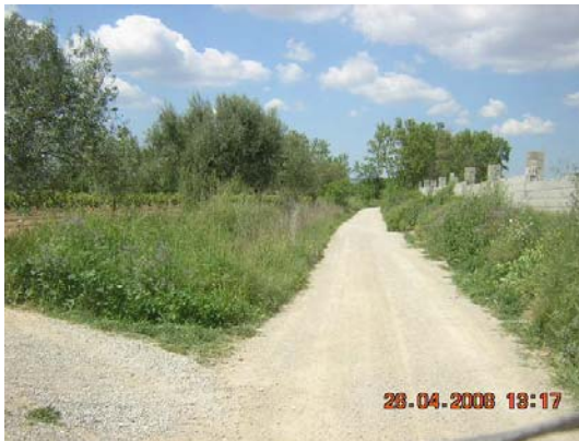
Tram 1: Parcel·la vallada