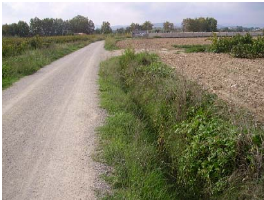
Tram 1: Detall cuneta