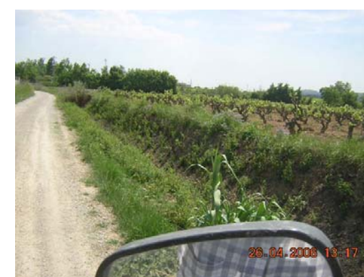
Tram 1: Detall cuneta