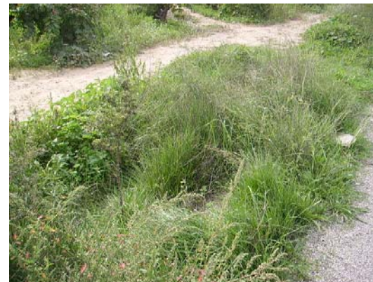
Tram 1: Detall cuneta