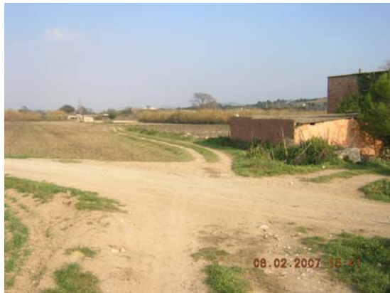
Tram 1: Enllaç camí Pedrera.