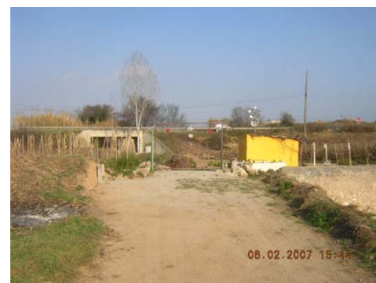
Tram 2: Interrupció camí.