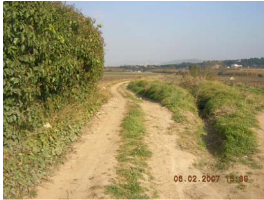
Tram 1: Estat del ferm. Cunetes.