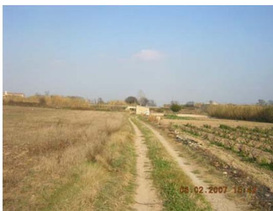
Tram 2: Estat del ferm.