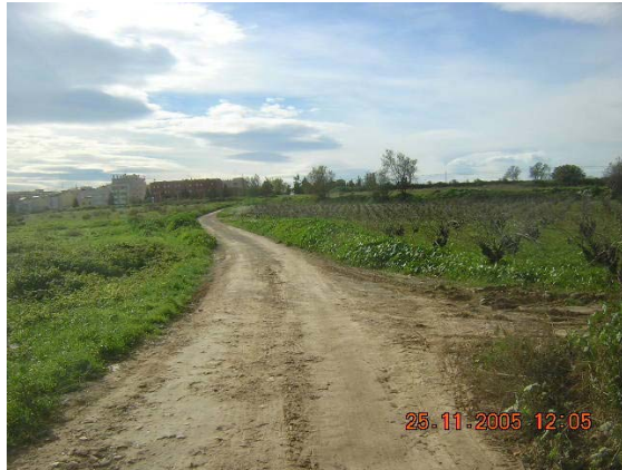
Tram 1. Tipus ferm.