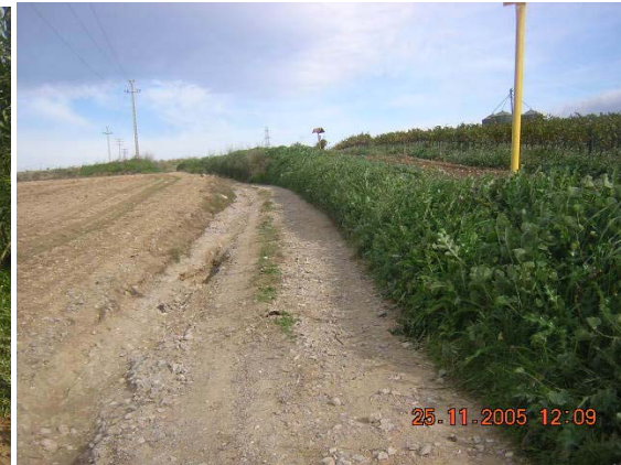
Tram 1. Tipus ferm.