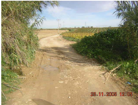
Tram 1: Pas d'aigua riera Adoberia.